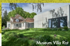
Museum Villa Rot