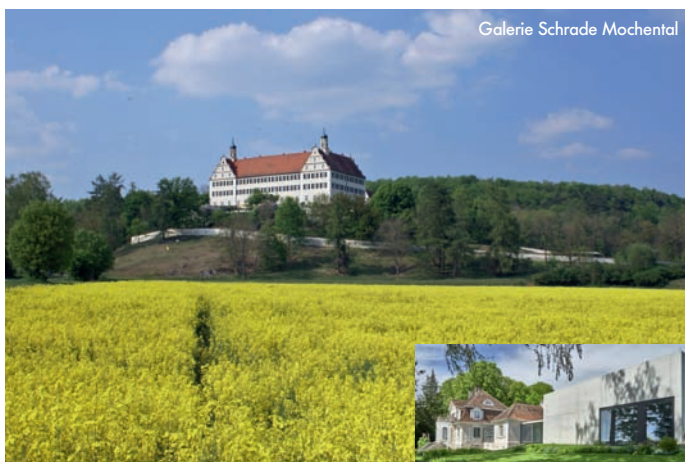
Galerie Schrade Mochental

(Ankündigung in der Presse und unserer Homepage) Ist in der Kunst aufgrund der im Grundgesetz garantierten Freiheit der Kunst alles erlaubt?