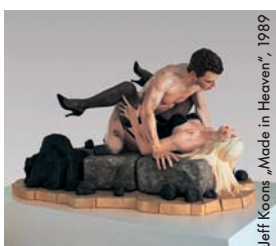
Jeff Koons „Made in Heaven“, 1989