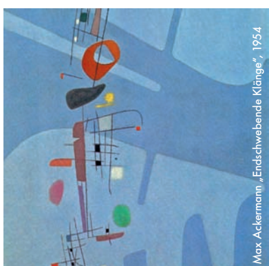
Max Ackermann „Endschwebende Klänge“, 1954

Susanne Immer interessiert sich für den prägnanten Ausschnitt, der aber eindeutig auf das Ganze verweist. Aus dieser Auseinandersetzung heraus entwickeln sich Zeichnungen auf Papier, Installationen und Objekte. Ihre Objekte wirken wie dreidimensionale Zeichnungen und ihre Zeichnungen vermitteln eine geradezu verblüffende Räumlichkeit, die eine ganz eigene Dynamik ausstrahlt.