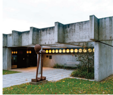
Kunstsammlung Domnick Nürtingen