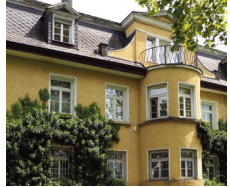
Ruoff Stiftung Nürtingen